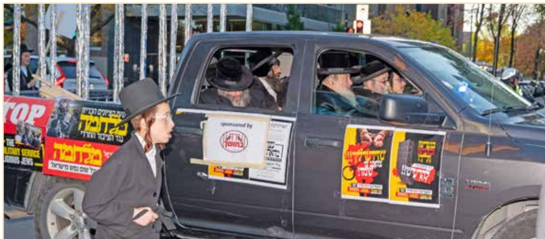
מערערע רבני עיר מאנטריאל וקאנאדא אינעם מאטארקאדע אויסצודרוקן אונזער מחאה קעגן די ארעסטן אויף בחורי ישראל

עצרת מחאה אדירה ביים קאנסולאט און מאנטריאל בראשות גדולי הרבנים שליט"א אויסצושרייען זעקת הגולה קעגן די גזירת שמד בארה"ק