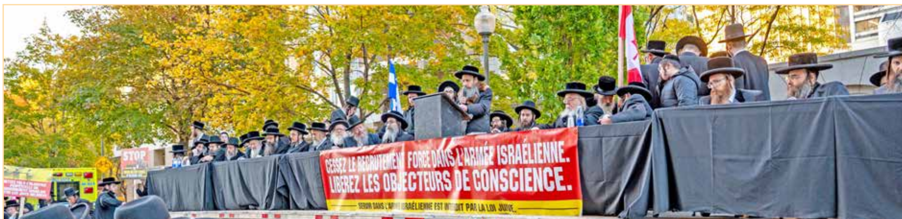
הגה"צ גאב"ד סאטמאר מאנטריאל שליט"א טרעט אויף מיט דברי מחאה