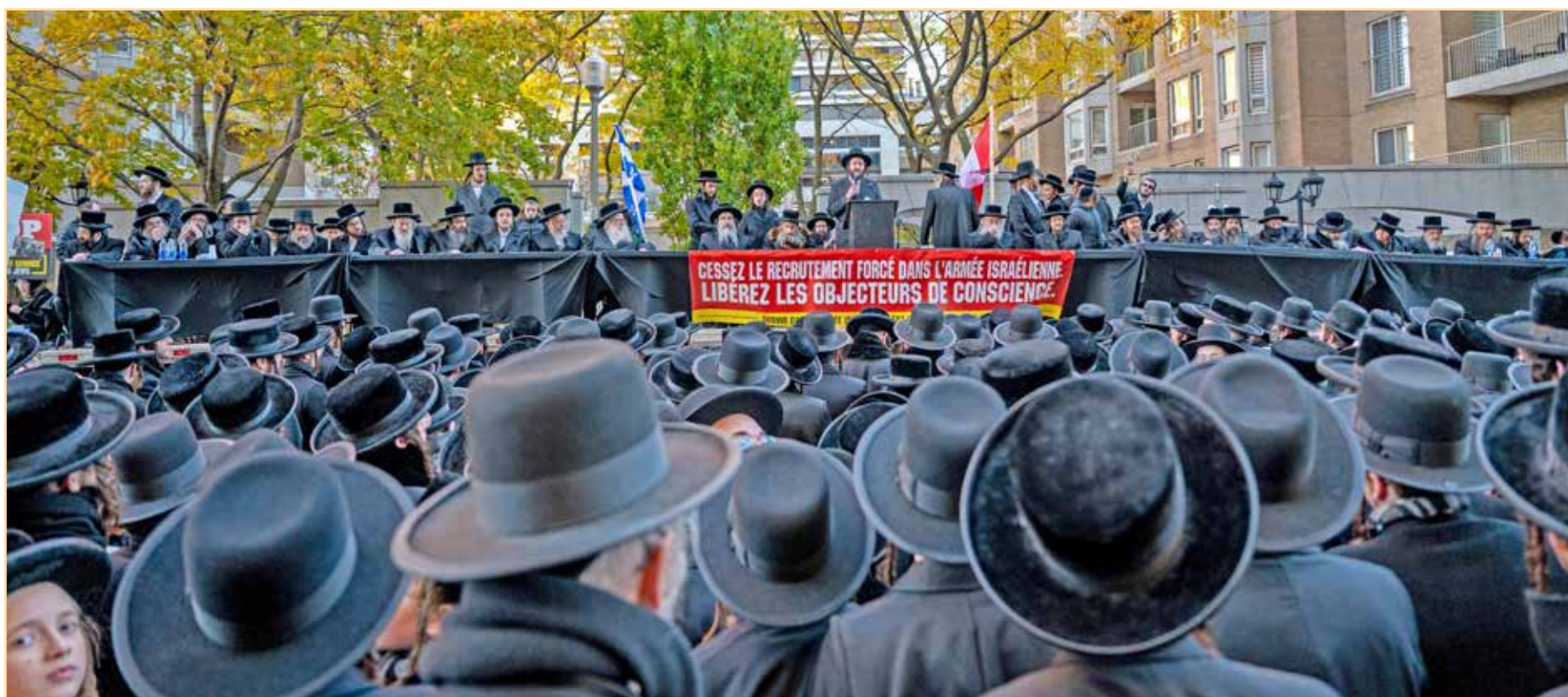
פילזייטיגע השתתפות פון גדולי רבני עיר מאנטריאל קעגן די רדיפת הדת אין ארה"ק