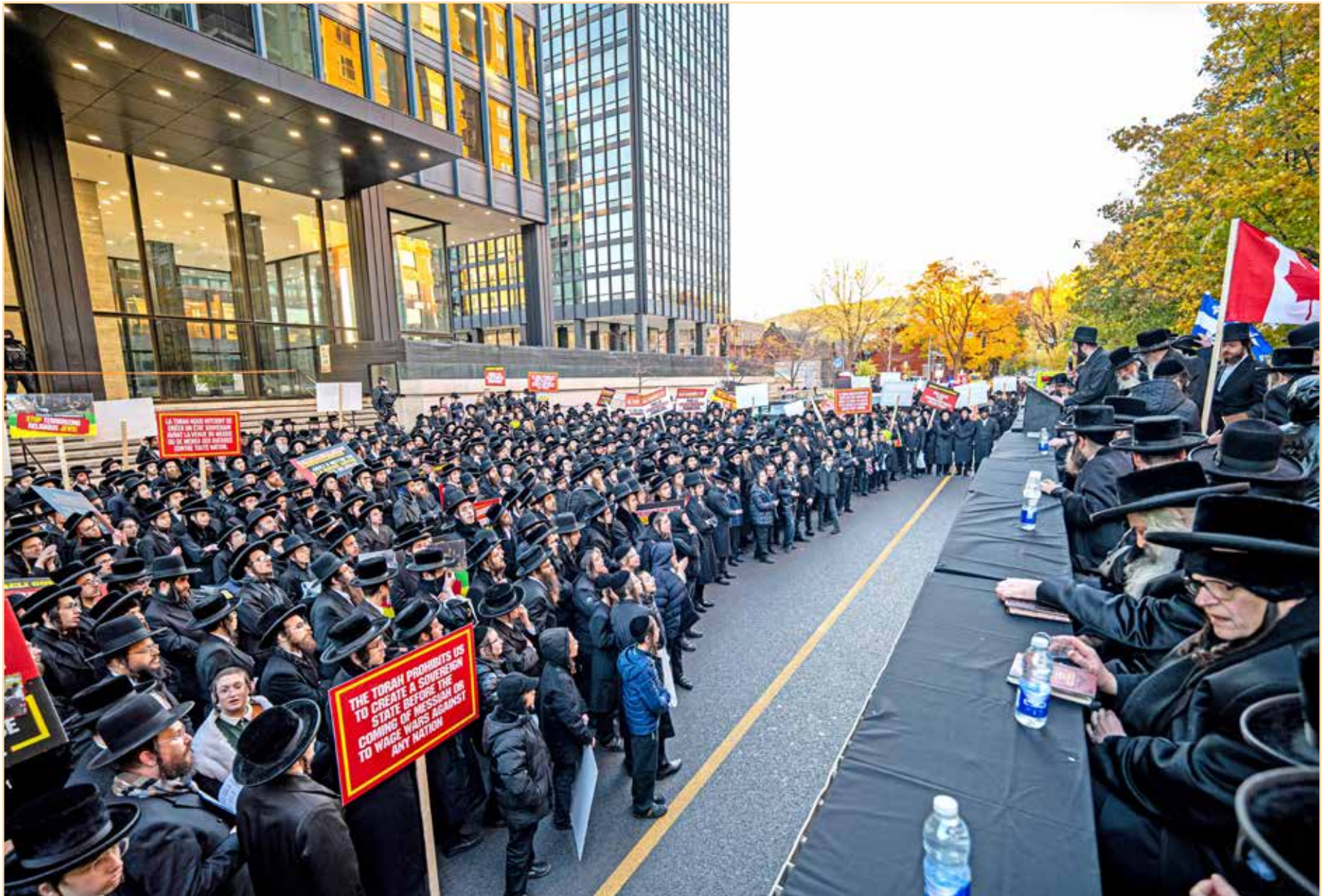
דער ציבור פארנט פון ציוני'טישן קאנסולאט

עצרת מחאה אדירה ביים קאנסולאט און מאנטריאל בראשות גדולי הרבנים שליט"א אויסצושרייען זעקת הגולה קעגן די גזירת שמד בארה"ק