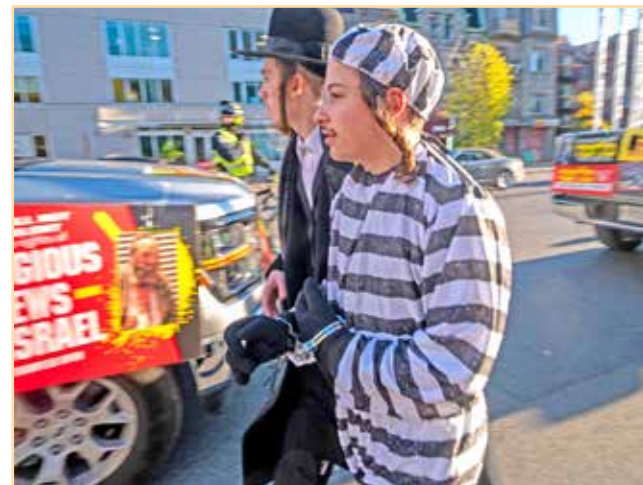
מיט קייטן אויפן דער האנט ביים ציוניסטישן קאנסולאט