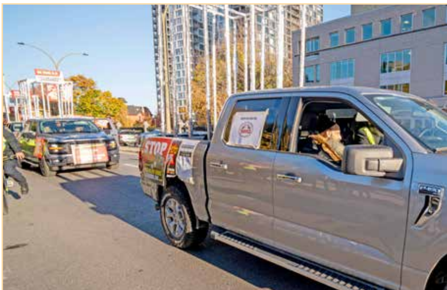
הגה"צ גאב"ד סאטמאר מאנטריאל שליט"א אין איינס פון די קארס אויפן וועג צום עצרת