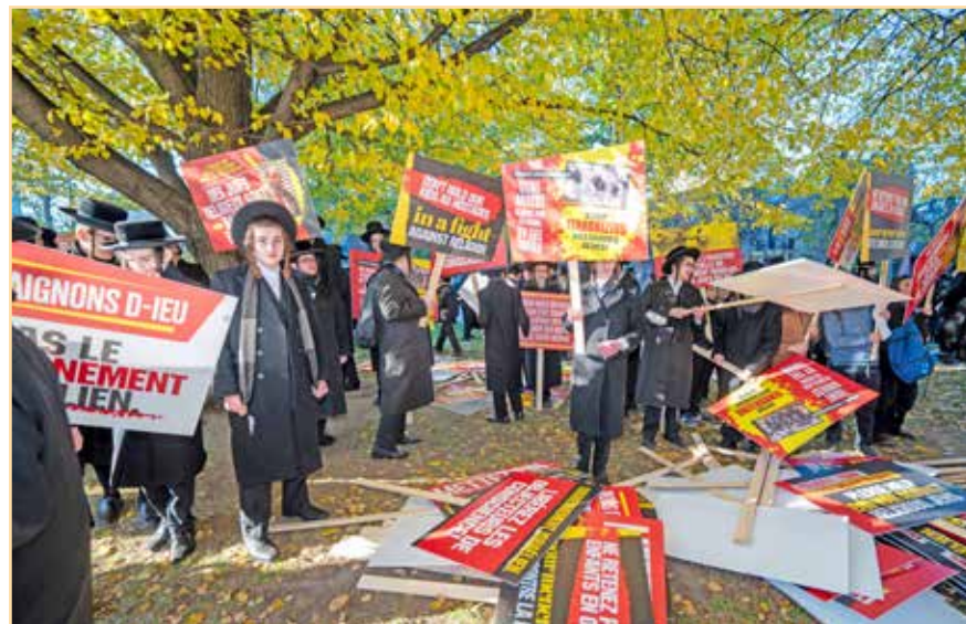
פילע שרייעדיגע שילדן אויפן פראנצויזישן שפראך אויסצושרייען דעם זעקת הגולה ביים פראטעסט אין מאנטריאל