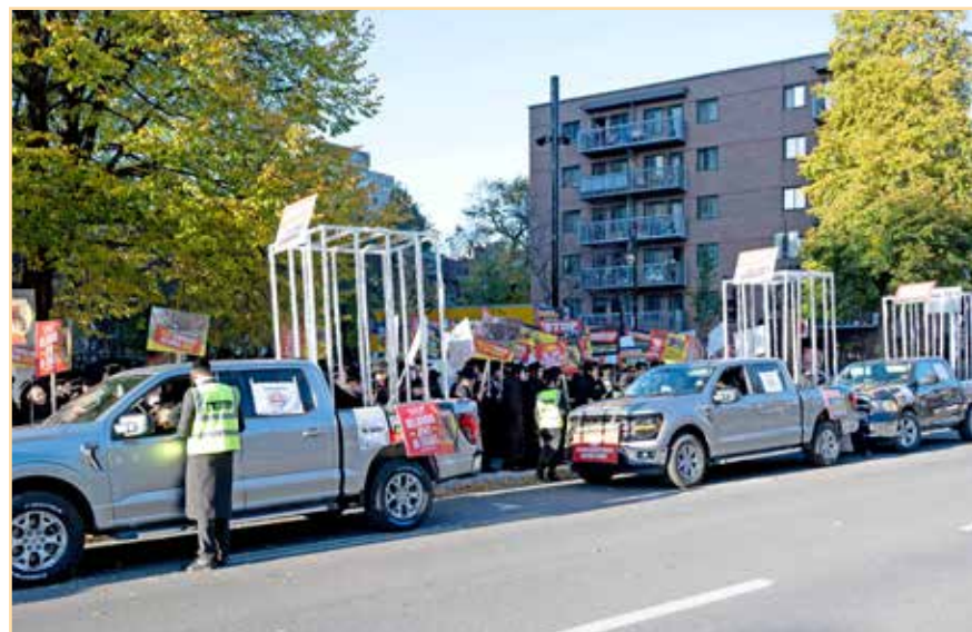
לכלא ולא לצבא: פלאטע טרעקלעך מיט תפיסה קעלערן צו דערקלערן שטאנדהאפטיגע שטעלונג פונעם יהדות החרדית