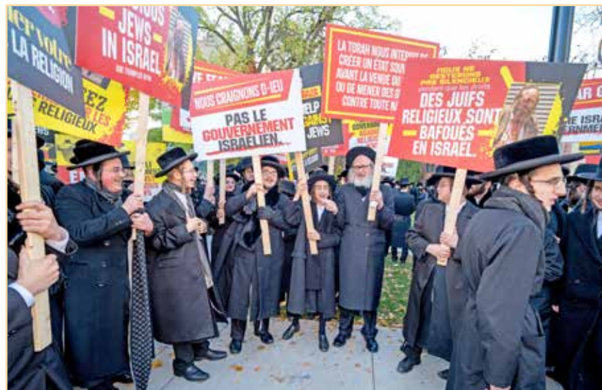
זקנים עם נערים ביים עצרת