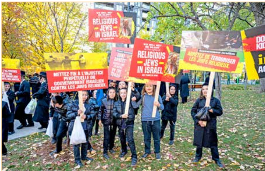
ילדי קאנאדא ברחובות העיר זיך אנצונעמען פאר אונזערע פארפלאגטע ברודער אין ארה"ק

עצרת מחאה אדירה ביים קאנסולאט און מאנטריאל בראשות גדולי הרבנים שליט"א אויסצושרייען זעקת הגולה קעגן די גזירת שמד בארה"ק